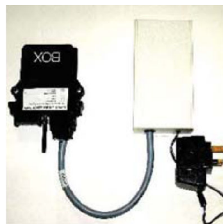
Box GSM Logger y Nodo Root

Se instaló un práctico portal web para proporcionar un sencillo acceso a datos en tiempo real.