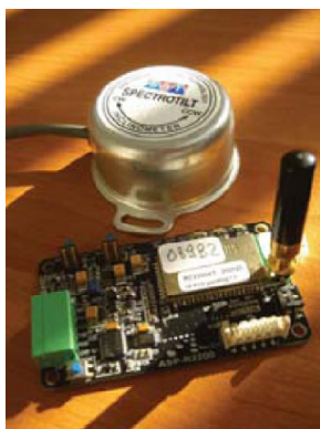
MeshBean con sensor Tilt